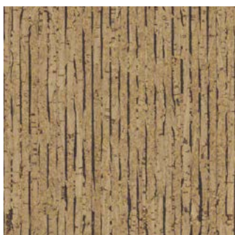
Mikado lackiert, furniert