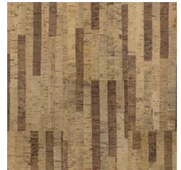
Strada lackiert, furniert