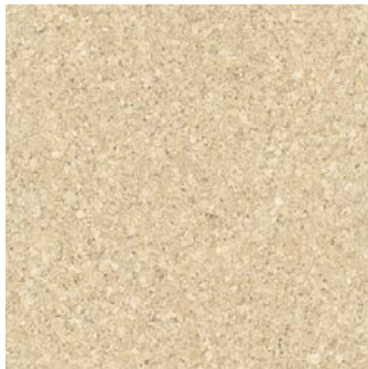
Mono creme lackiert, 2-schichtig