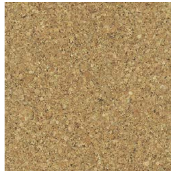
Mono lackiert, 2-schichtig