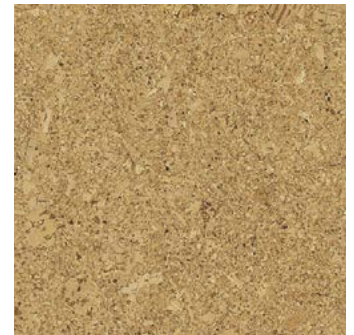
Cortina lackiert, furniert