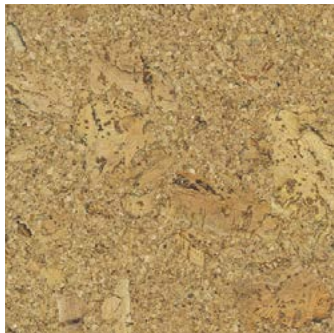
Nizza lackiert, furniert