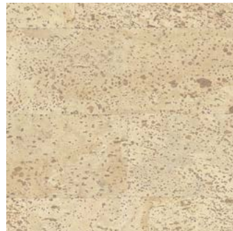
Capri 65 creme lackiert, furniert