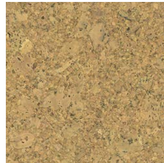
Solo lackiert, furniert