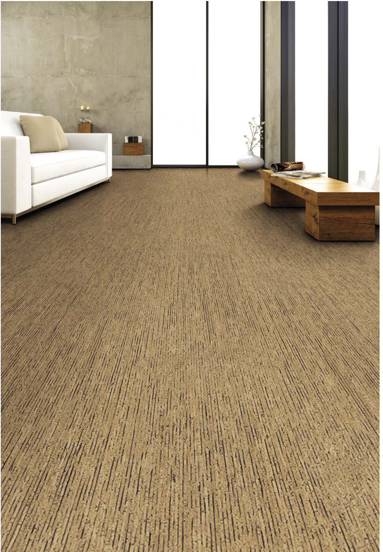
Sombra Kork | Mikado